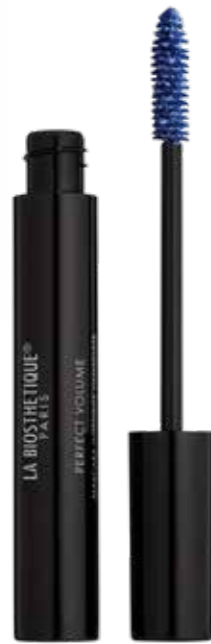
PERFECT VOLUME MIDNIGHT BLUE