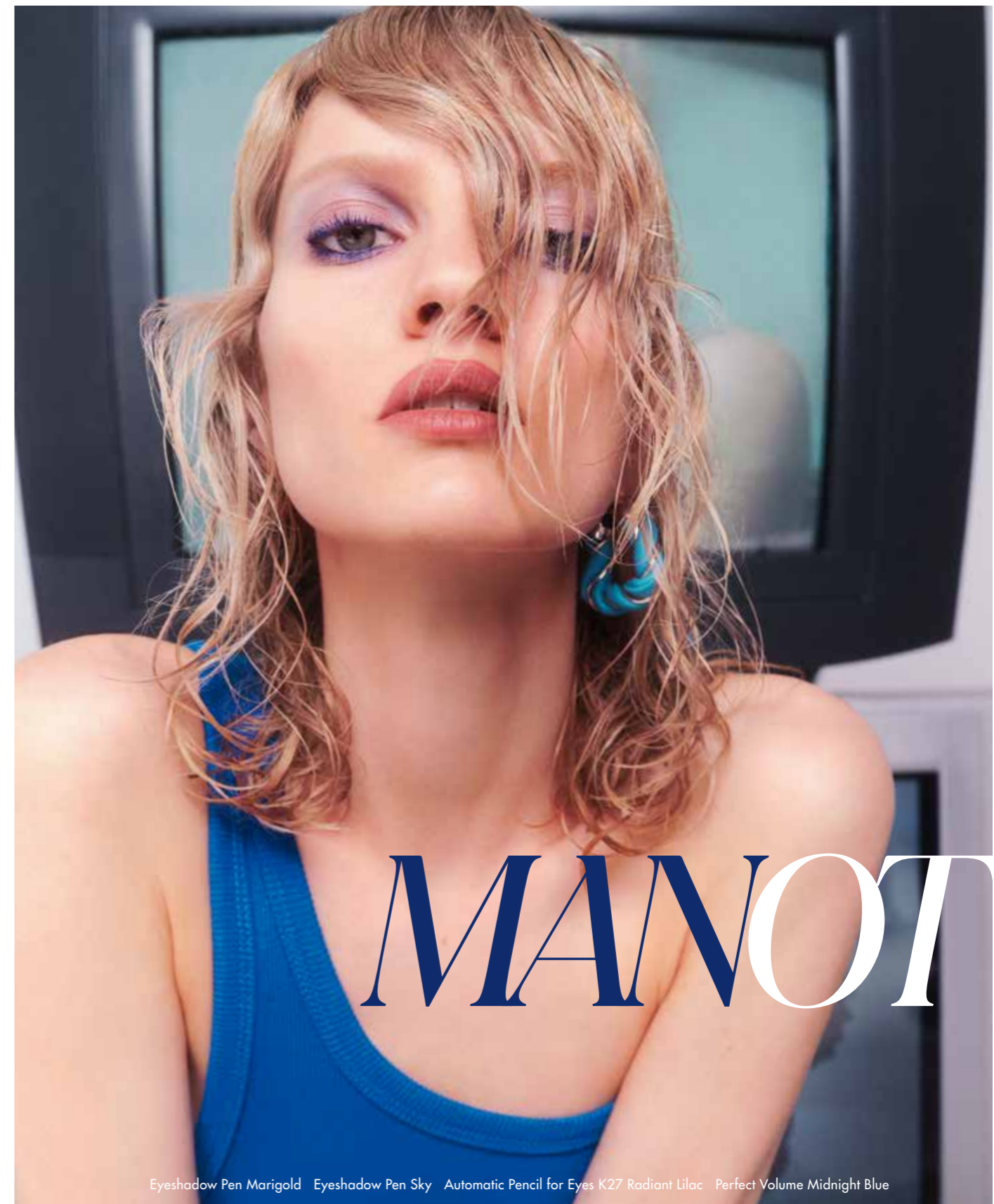
Eyeshadow Pen Marigold Eyeshadow Pen Sky Automatic Pencil for Eyes K27 Radiant Lilac Perfect Volume Midnight Blue

In spektakulärem Blauviolett umrandet, erhält er eine elektrisierende Intensität, die durch das Mitternachtsblau der Wimpern vertieft wird. Den sinnlichen Gegenpart bildet der samtige Blütenton von Sensual Lipstick Magnolia auf den Lippen.