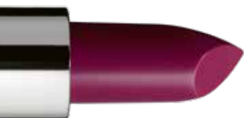
SENSUAL LIPSTICK G332 MULBERRY