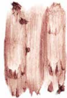
EYESHADOW PEN MARIGOLD